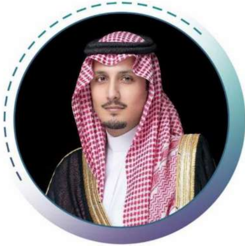
لصاحب السمو الملكي الأمير أحمد بن فهد بن عبدالعزيز آل سعود نائب أمير المنطقة الشرقية