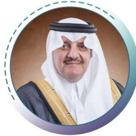
لصاحب السمو الملكي الأمير سعود بن نايف بن عبدالعزيز آل سعود أمير المنطقة الشرقية