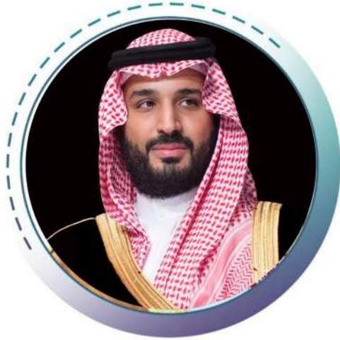
صاحب السمو الملكي الأمير